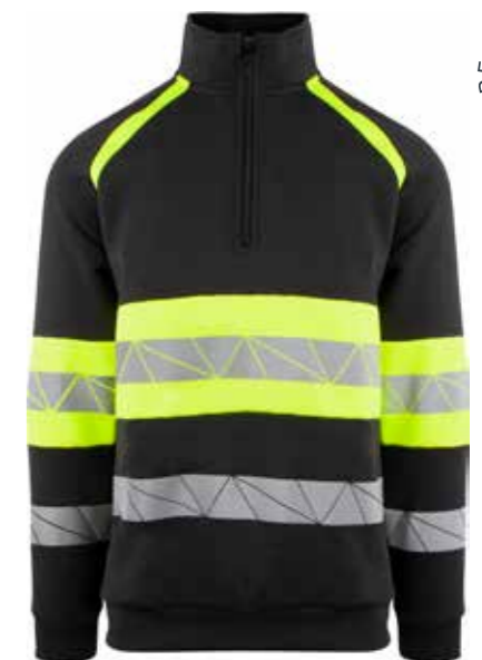
916 SORT/SAFETY GUL