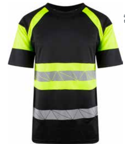
916 SORT/SAFETY GUL