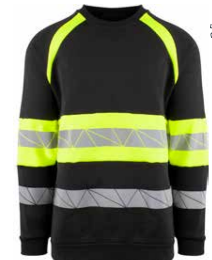
916 SORT/SAFETY GUL